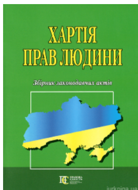
Хартія прав людини. Збірник законодавчих актів. Алерта