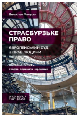
Страсбурзьке право. Європейський суд з прав людини. Теорія, принципи, практика