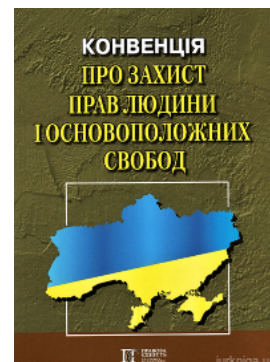
Конвенція про захист прав людини і основоположних свобод. Збірник законодавчих актів. Алерта