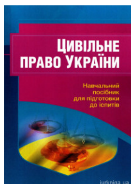
Цивільне право України. Навчальний посібник для підготовки до іспитів