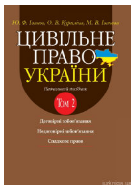
Цивільне право України. Том 2. Навчальний посібник у 2 томах. Видання 2-ге доповнене і перероблене