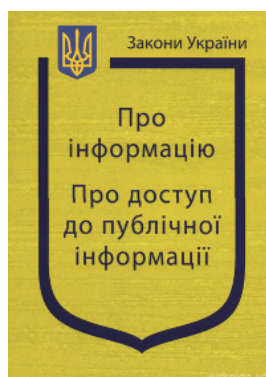
Закони України "Про інформацію", "Про доступ до публічної інформації"