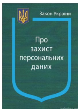
Закон України "Про захист персональних даних"