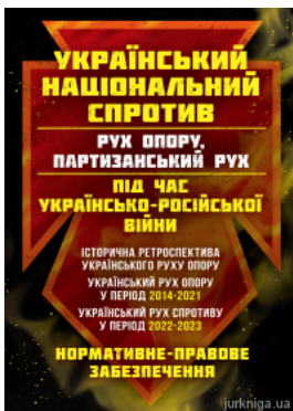
Український національний спротив (рух опору, партизанський рух) під час Українсько-російської війни: історична ретроспектива українського руху...