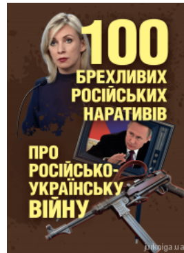
100 брехливих російських наративів про російсько-українську війну