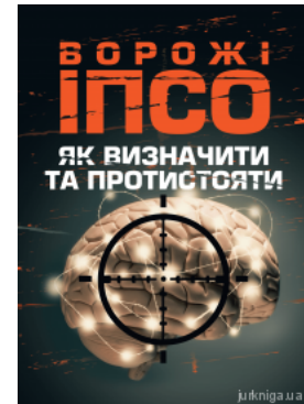
Ворожі ІПСО. Як визначити та протистояти