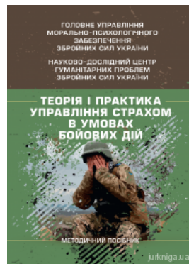
Теорія і практика управління страхом в умовах бойових дій