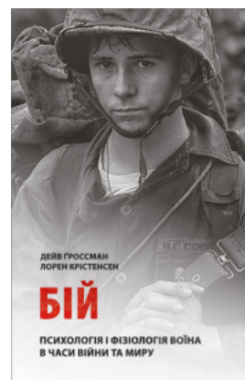
Бій. Психологія і фізіологія війни в часи війни та миру