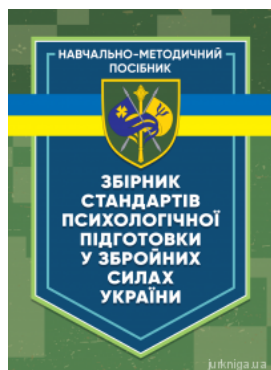
Збірник стандартів психологічної підготовки у Збройних Силах України