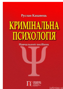
Кримінальна психологія. Навчальний посібник