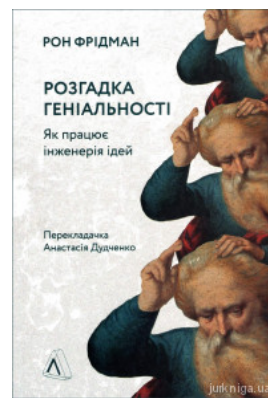
Розгадка геніальності. Як працює інженерія ідей

Перейти до галузі права Філософія та психологія права