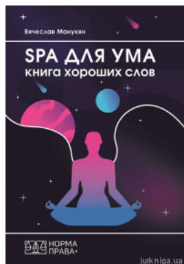
SPA для ума. Книга хороших слов