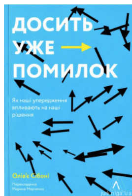
Досить уже помилок. Як наші упередження впливають на наші рішення