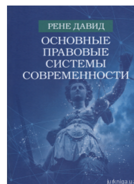
Основные правовые системы современности

Перейти до галузі права Юридичний менеджмент