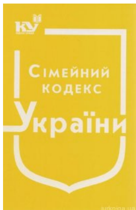
Сімейний кодекс України