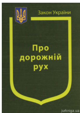
Закон України "Про дорожній рух"