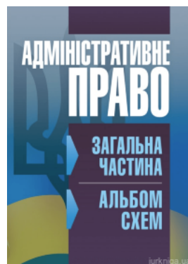
Адміністративне право. Загальна частина (альбом схем).