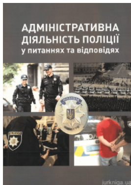
Адміністративна діяльність поліції у питаннях та відповідях