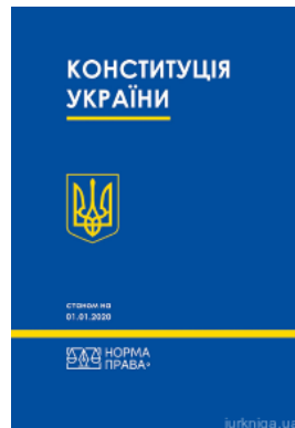
Конституція України. Норма права