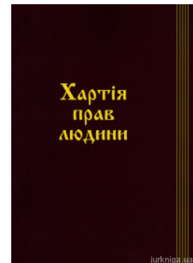
Хартія прав людини. Збірник