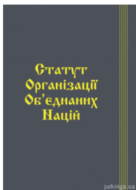
Статут Організації Об'єднаних Націй. Паливода