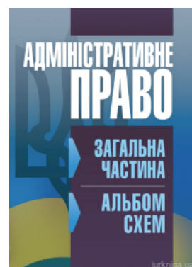
Адміністративне право. Загальна частина (альбом схем).