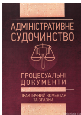
Адміністративне судочинство. Процесуальні документи. Практичний коментар та зразки