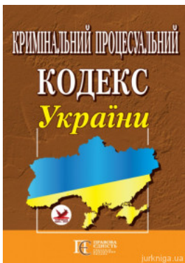
Кримінальний процесуальний кодекс України. Алерта