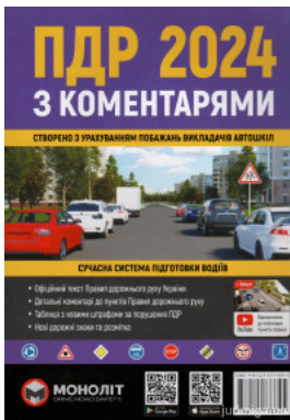
ПДР України 2024 з коментарями