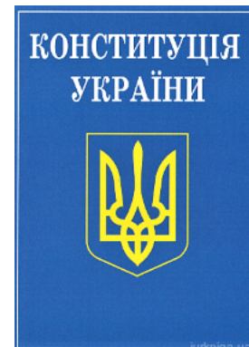
Конституція України. Алерта