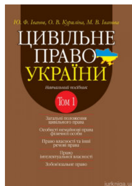
Цивільне право України. Том 1. Навчальний посібник у 2 томах. Видання 2-ге доповнене і перероблене