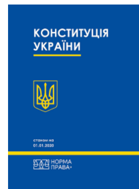
Конституція України. Норма права

Перейти до галузі права Адміністративне право