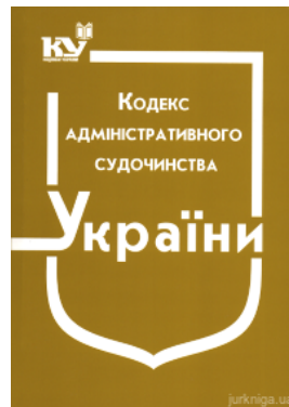
Кодекс адміністративного судочинства України