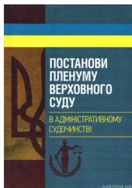
Постанови Пленуму Верховного суду в адміністративному судочинстві