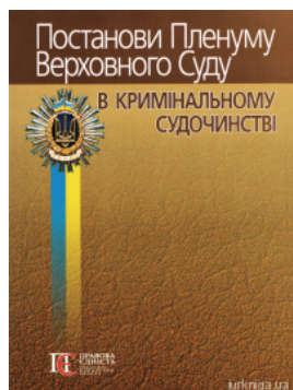
Постанови Пленуму Верховного Суду в кримінальному судочинстві