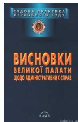
Судова практика Верховного Суду. Висновки Великої Палати щодо адміністративних справ