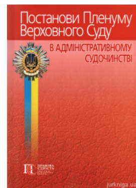
Постанови Пленуму Верховного Суду в адміністративному судочинстві

Перейти до галузі права Адміністративне право