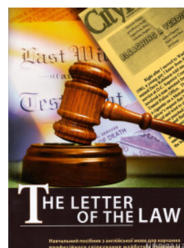
Буква закону. The letter of the law