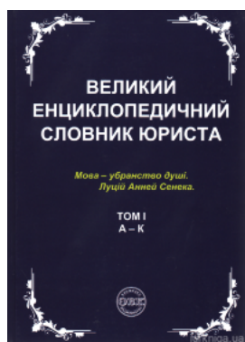
Великий енциклопедичний словник юриста у 3-х томах