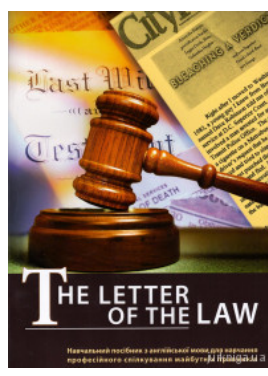
Буква закону. The letter of the law