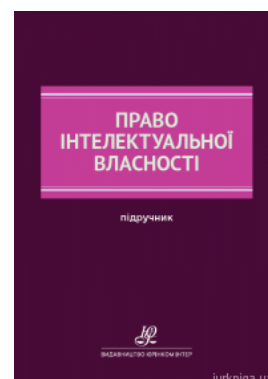
Право інтелектуальної власності: підручник