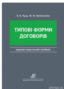
Типові форми договорів. Видання друге