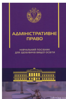
Адміністративне право. Навчальний посібник для здобувачів вищої освіти