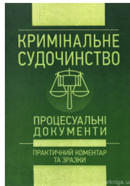
Кримінальне судочинство. Процесуальні документи. Практичний коментар та зразки