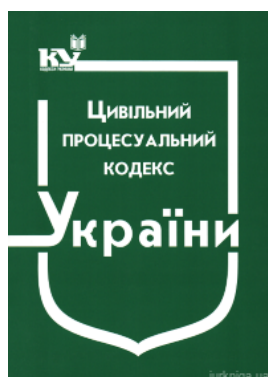
Цивільний процесуальний кодекс України