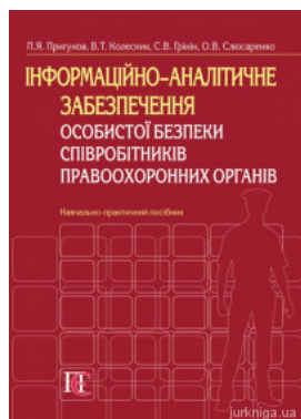
Інформаційно-аналітичне забезпечення особистої безпеки співробітників правоохоронних органів

Перейти до галузі права Адміністративне право