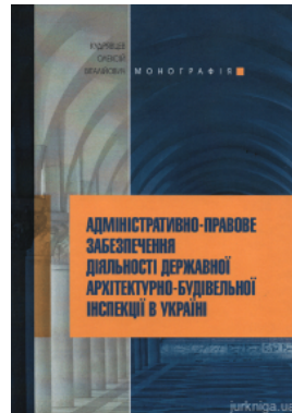
Адміністративно-право ве забезпечення діяльності державної архітектурно-будівельн ої інспекції в Україні