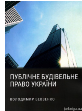
Публічне будівельне право України