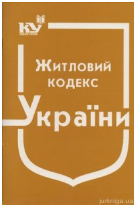
Житловий кодекс України