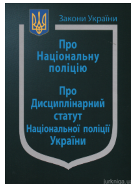
Закон України "Про Національну поліцію", "Про дисциплінарний статут Національної поліції України"