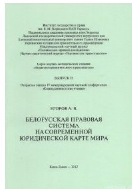
Белорусская правовая система на современной юридической карте мира