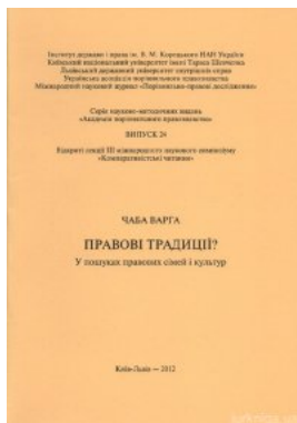
Правові традиції? У пошуках правових сімей і культур