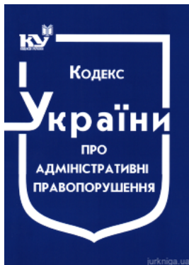
Кодекс України про адміністративні правопорушення