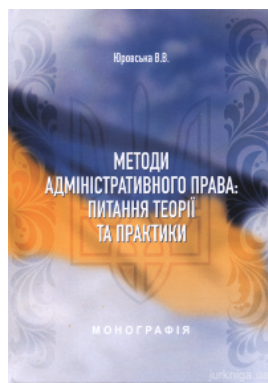
Методи адміністративного права: питання теорії та практики