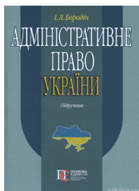
Адміністративне право України. Підручник