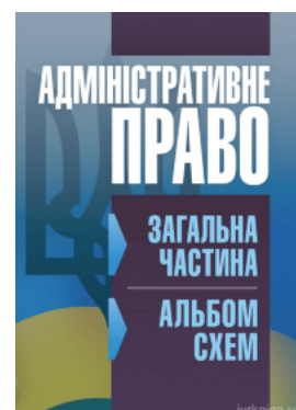
Адміністративне право. Загальна частина (альбом схем).