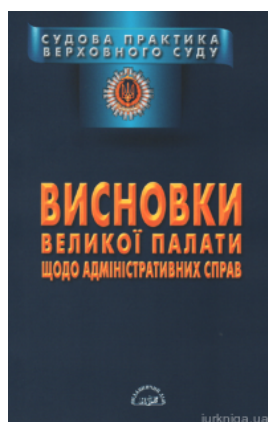
Судова практика Верховного Суду. Висновки Великої Палати щодо адміністративних справ