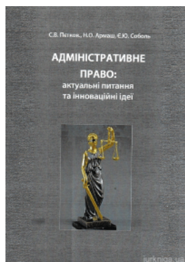
Адміністративне право: актуальні питання та інноваційні ідеї