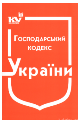
Господарський кодекс України