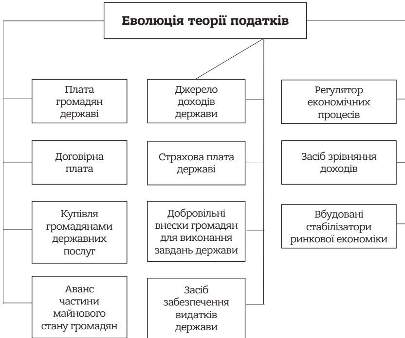
Схема 1. Еволюція теорії податків

У більшості сучасних слов'янських мов відповідники слова «податок» зберегли свою спільну кореневу основу: білоруською – padatak , польською – podatek , словацькою та чеською – daň , словенською – davek , болгарською – данък . У той же час в російській – налог , боснійській, хорватській та сербській – porez та poroz , відповідно.