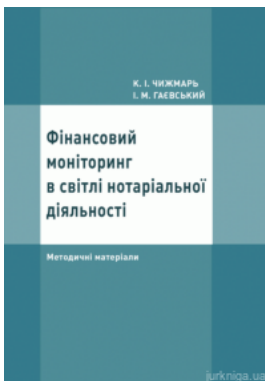
Фінансовий моніторинг в світлі нотаріальної діяльності