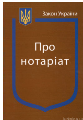
Закон України "Про нотаріат"