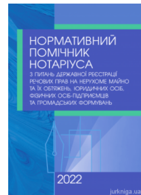
Нормативний помічник нотаріуса з питань державної реєстрації речових прав на нерухоме майно, юридичних осіб, фізичних осіб-підприємців та...

Перейти до галузі права Адміністративне право