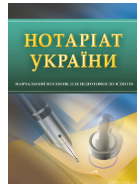
Нотаріат України. Навчальний посібник для підготовки до іспитів