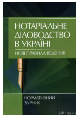
Нотаріальне діловодство в Україні. Нові правила ведення