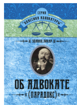
Об адвокате (Парадокс)