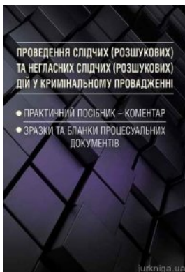
Проведення слідчих (розшукових) та негласних слідчих (розшукових) дій у кримінальному провадженні