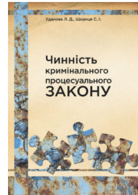
Чинність кримінального процесуального закону