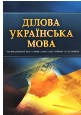
Ділова українська мова. Навчальний посібник для підготовки до іспитів