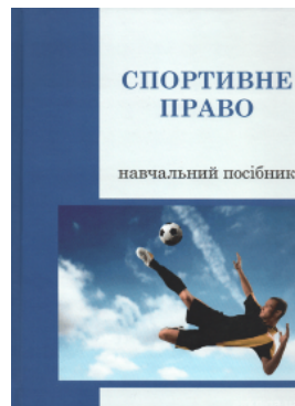
Спортивне право. Навчальний посібник