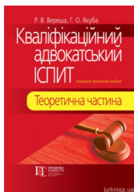
Кваліфікаційний адвокатський іспит. Теоретична частина