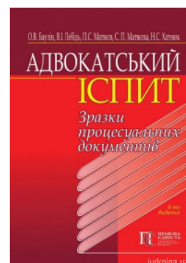
Адвокатський іспит: зразки процесуальних документів