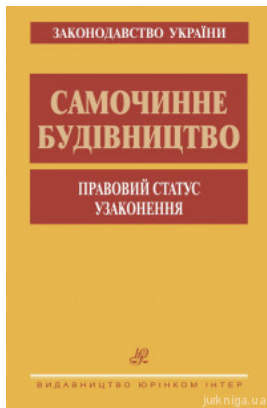
Самочинне будівництво. Правовий статус. Узаконення