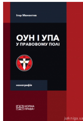
ОУН і УПА у правовому полі