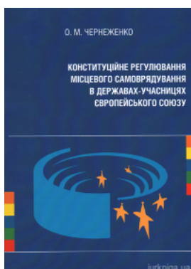
Конституційне регулювання місцевого самоврядування в державах-учасницях Європейського Союзу

Перейти до галузі права Теорія держави і права