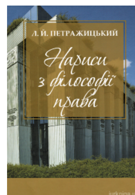
Нариси з філософії права. Л.Й. Петражицький