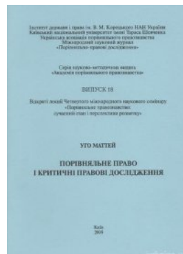
Порівняльне право і критичні правові дослідження