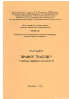
Правові традиції? У пошуках правових сімей і культур