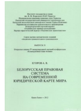
Белорусская правовая система на современной юридической карте мира