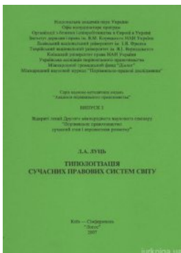
Типологізація сучасних правових систем світу