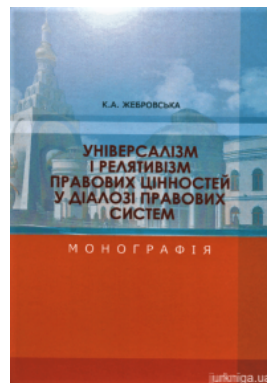
Універсалізм і релятивізм правових цінностей у діалозі правових систем