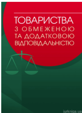
Товариства з обмеженою та додатковою відповідальністю: практичний посібник