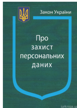
Закон України "Про захист персональних даних"