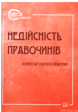
Недійсність правочинів. Коментар судової практики