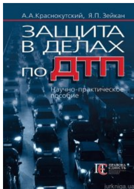
Защита в делах по ДТП Науч.-практ. пособ