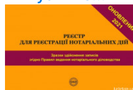
Реєстр для реєстрації нотаріальних дій. Зразки здійснення записів згідно Правил ведення нотаріального діловодства

Перейти до галузі права Цивільне право та процес