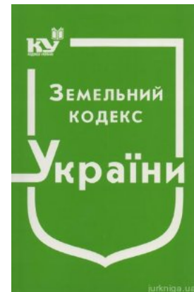
Земельний кодекс України