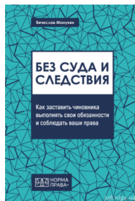
Без суда и следствия