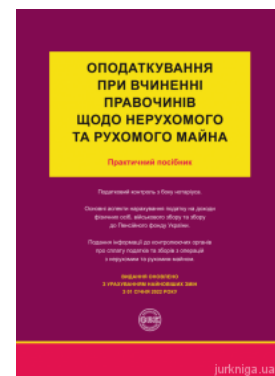
Оподаткування при вчиненні правочинів щодо нерухомого та рухомого майна

Перейти до галузі права Цивільне право та процес