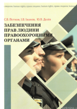
Забезпечення прав людини правоохоронними органами

Перейти до галузі права Конституційне право