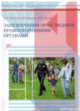
Забезпечення прав людини правоохоронними органами