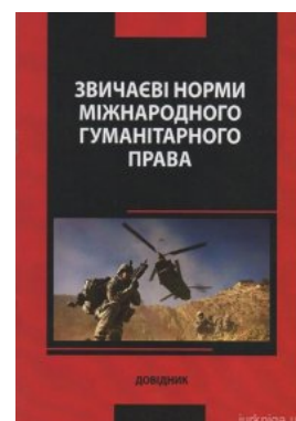
Звичаєві норми міжнародного гуманітарного права