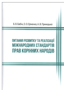
Питання розвитку та реалізації міжнародних стандартів прав корінних народів