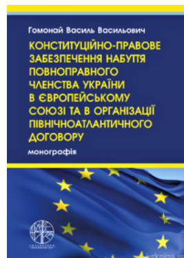
Конституційно-правове забезпечення набуття повноправного членства України в Європейському Союзі та в Організації Північноатлантичного договору