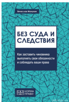
Без суда и следствия