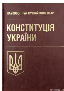
Конституція України. Науково-практичний коментар