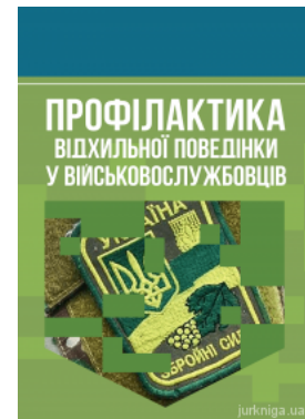
Профілактика відхильної поведінки у військовослужбовців