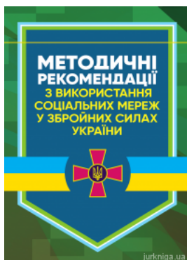
Методичні рекомендації з використання соціальних мереж у Збройних Силах України