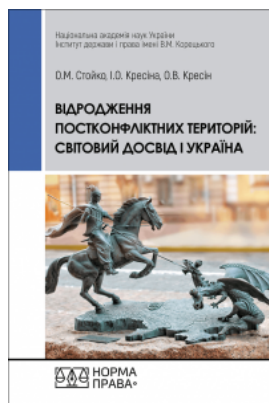
Відродження постконфліктних територій: світовий досвід і Україна