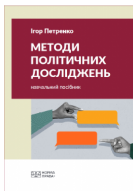
Методи політичних досліджень