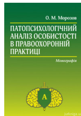
Патопсихологічний аналіз особистості в правоохоронній практиці

Перейти до галузі права Конституційне право