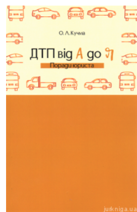
ДТП від А до Я. Поради юриста