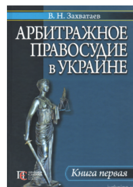
Арбитражное правосудие в Украине. Книга первая