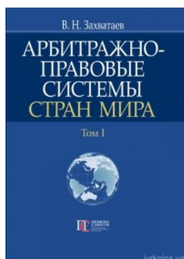
Арбитражно-правовые системы стран мира. Том 1