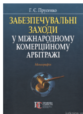
Забезпечувальні заходи у міжнародному комерційному арбітражі