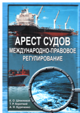
Арест судов. Международно-правовое регулирование