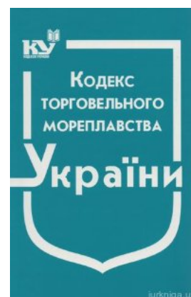
Кодекс торгового мореплавства України