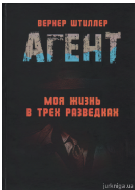
Агент. Моя жизнь в трёх разведках