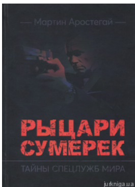
Рыцари сумерек. Тайны спецслужб мира