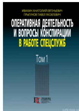
Оперативная деятельность и вопросы конспирации в работе спецслужб. Том 1