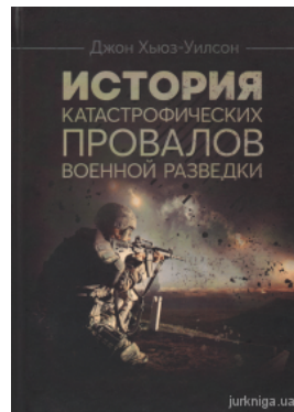
История катастрофических провалов военной разведки