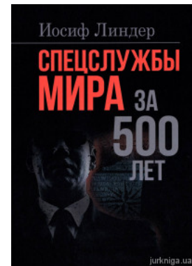
Спецслужбы мира за 500 лет