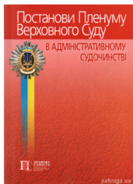
Постанови Пленуму Верховного Суду в адміністративному судочинстві

Перейти до галузі права Транспортне право