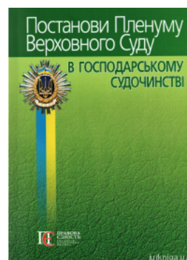
Постанови Пленуму Верховного Суду в господарському судочинстві