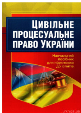
Цивільне процесуальне право України. Навчальний посібник для підготовки до іспитів