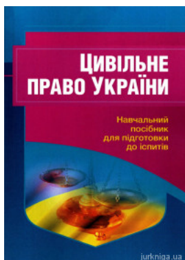
Цивільне право України. Навчальний посібник для підготовки до іспитів