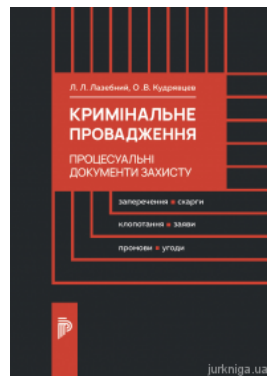
Кримінальне провадження. Процесуальні документи захисту