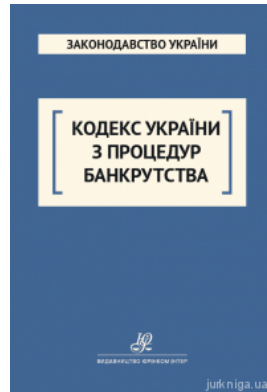
Кодекс України з процедур банкрутства. Юрінком Інтер