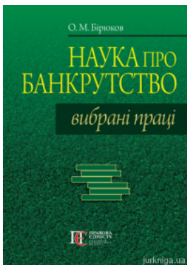
Наука про банкрутство. Вибрані праці