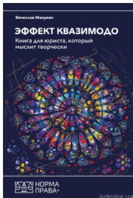
Эффект Квазимодо. Книга для юриста, который мыслит творчески