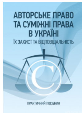
Авторське право та суміжні права в Україні. Їх захист та відповідальність