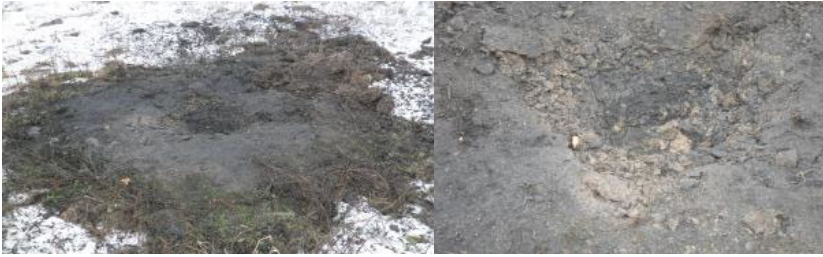
Рисунок 3 - види воронки від мінометних та артилерійських снарядів.