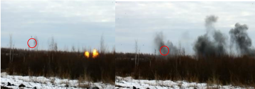
Рисунок 6 - імітація атаки на взводний опорний пункт з повітря.

Спостерігач за наземною та повітряною обстановкою здійснює огляд місцевості та повітряного простору (Рис. 7). Виявивши повітряного противника, подає сигнал про небезпеку нанесення удару з повітря.