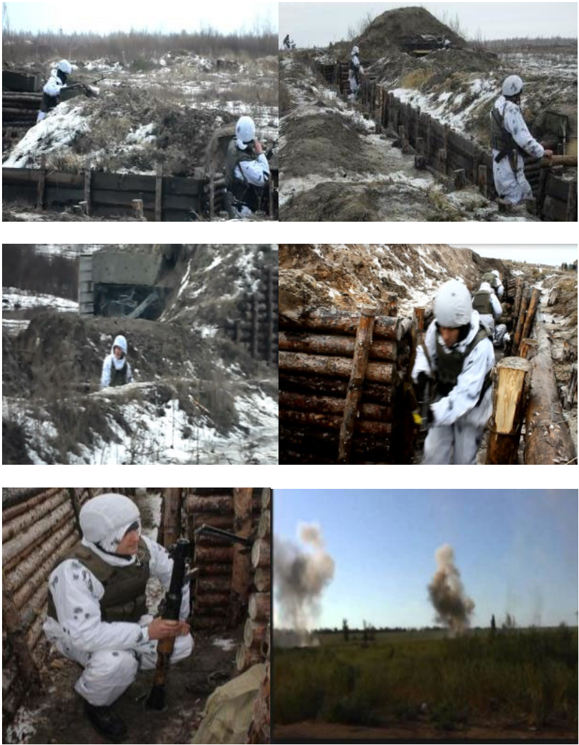
Рисунок 5 - особовий склад займає позиції в межах взводного опорного пункту в готовності до відбиття удару противника.

обстановкою. Місце спостерігача повинно бути обладнано поза межами ВОП (Рис. 4), як правило на панівних висотах.