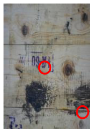
Рисунок 2 - уражаюча дія убивчих елементів артилерійських боєприпасів.