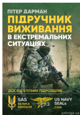
Підручник вживання в екстремальних ситуаціях. Досвід спеціальних підрозділів світу