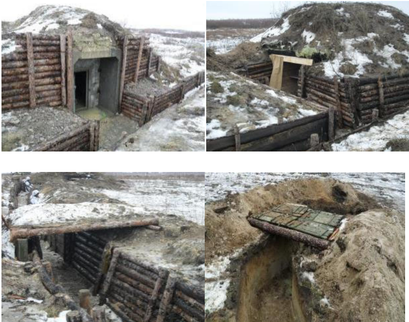
Рисунок 4 - варіанти обладнання укриття для захисту особового складу.

Керівник заняття визначає зі складу навчаємих спостерігача, із завданням здійснення спостереження за наземною та повітряною