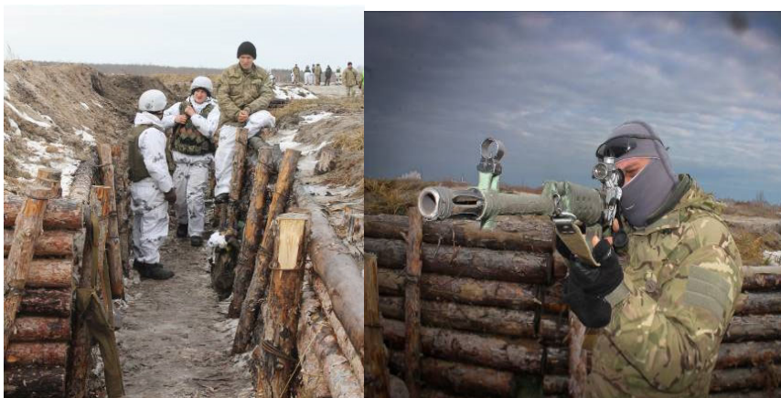
Рисунок 9 - розкриття місця свого знаходження.

Військовослужбовці ховаються в укриття та займають свої вогневі позиції (Рис.10) у відповідності до бойового розрахунку.