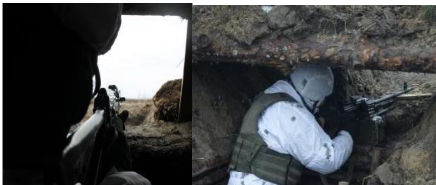
Рисунок 7 - спостерігач здійснює огляд місцевості та повітряного простору.

Визначений командиром спостерігач продовжує спостереження за обстановкою із укриття та інформує командира про обстановку, що склалась.