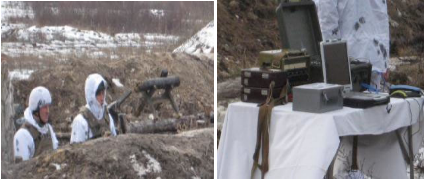
Рисунок 8 - показ можливостей ТЗР противника.

Показ новітньої системи передачі інформації, за допомогою якої військовослужбовці можуть безпечно здійснювати звонки на мобільні номери українських мобільних операторів. Даною системою пропонується обладнати всі стаціонарні блок пости в зоні проведення АТО.