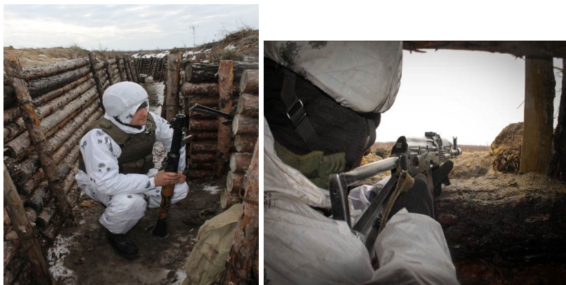
Рисунок 10 – зайняття позицій.

Військовослужбовці ховаються в укриття та займають свої вогневі позиції (Рис.10) у відповідності до бойового розрахунку.