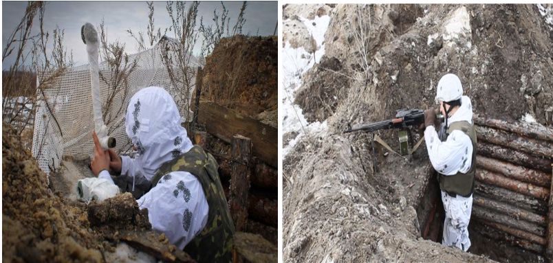
Рисунок 11 – знищення снайпера.

орієнтовні координати виявленої цілі. Наприклад: “Виявив постріл орієнтовно на десять годин, орієнтир 5”, дальність 600”.