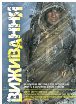
Вживання. Довідковий матеріал для проведення занять в Збройних силах України