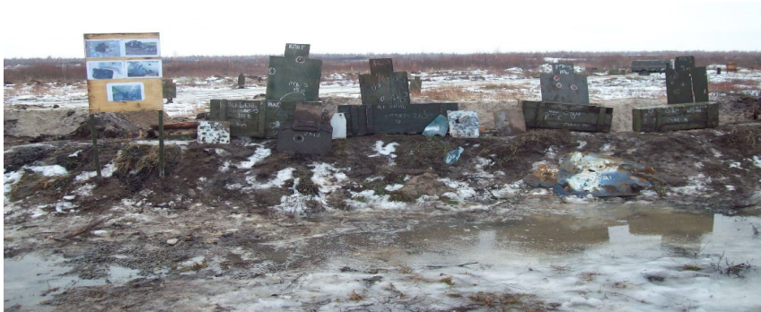
Рисунок 1 - наслідки уражаючих факторів озброєння бойових машин, ручних (реактивних) протитанкових гранатометів, ручних осколкових гранат, стрілецької зброї.

На мішенях показані (Рис. 1) наслідки уражаючих факторів (проникаючі отвори) від озброєння бойових машин, ручних (реактивних) протитанкових гранатометів, ручних осколкових гранат, стрілецької зброї з відстані стрільби - до 100 метрів: