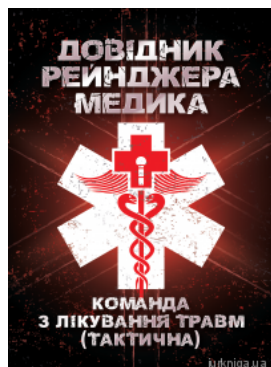
Довідник рейнджера-медика. Команда з лікування травм (тактична)