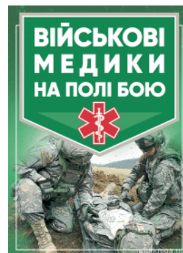
Військові медики на полі бою