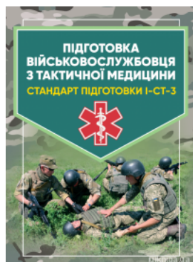
Підготовка військовослужбовця з тактичної медицини. Стандарт підготовки І-СТ-3