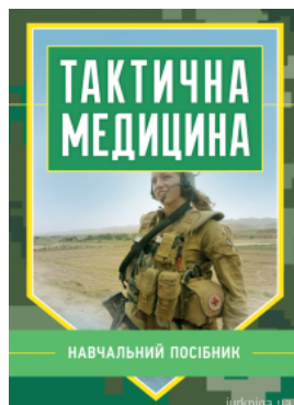
Тактична медицина. Навчальний посібник