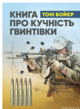
Книга про кучність гвинтівки