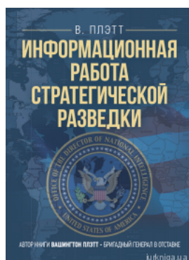
Информационная работа стратегической разведки. Основные принципы