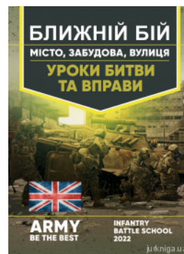
Ближній бій. Місто, забудова, вулиця. Уроки битви та вправи