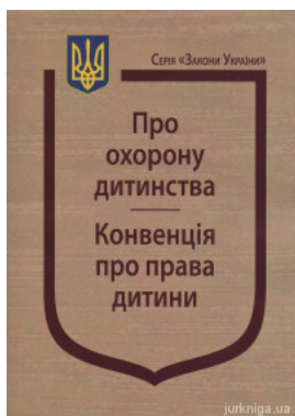
Закон України "Про охорону дитинства", Конвенція про права дитини