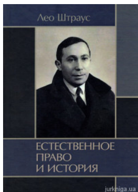
Естественное право и история