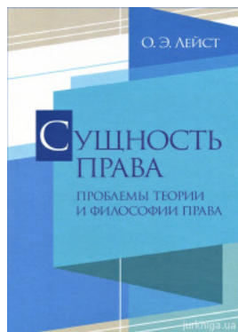
Сущность права. Проблемы теории и философии права