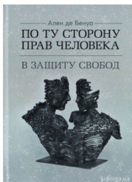
По ту сторону прав человека. В защиту свобод