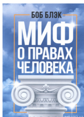
Миф о правах человека