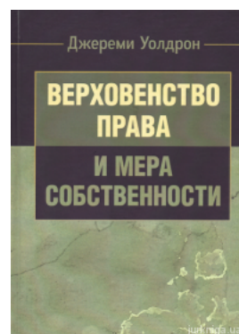
Верховенство права и мера собственности