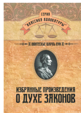
Избранные произведения о духе законов

Перейти до галузі права Філософія та психологія права