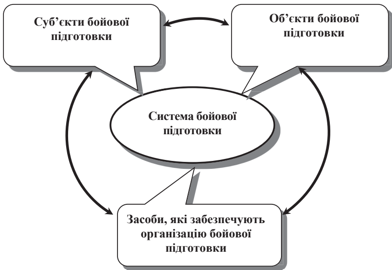
Рисунок 1 – складові елементи системи бойової підготовки.

Складові елементи системи бойової підготовки наведено на рисунку 1.