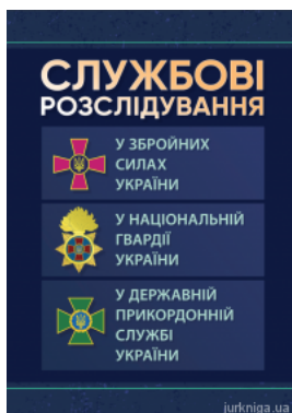
Службові розслідування: у Збройних Силах України, у Національній гвардії України, у Державній прикордонній службі України