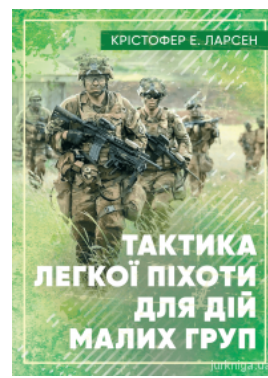
Тактика легкої піхоти для дій малих груп