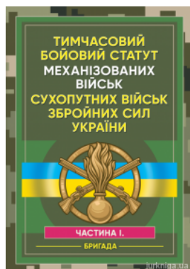
Тимчасовий бойовий статут Механізованих військ сухопутних військ Збройних Сил України. Частина 1 (бригада). ЦУЛ