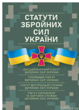
Статути збройних сил України