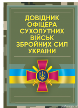
Довідник офіцера Сухопутних військ Збройних Сил України