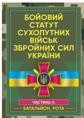
Бойовий статут сухопутних військ Збройних сил України. Частина 2 (батальйон, рота). ЦУЛ